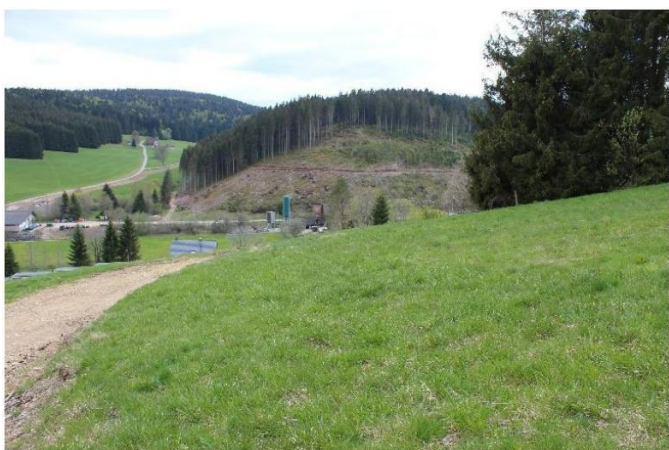
Fotos des Planungsbereichs