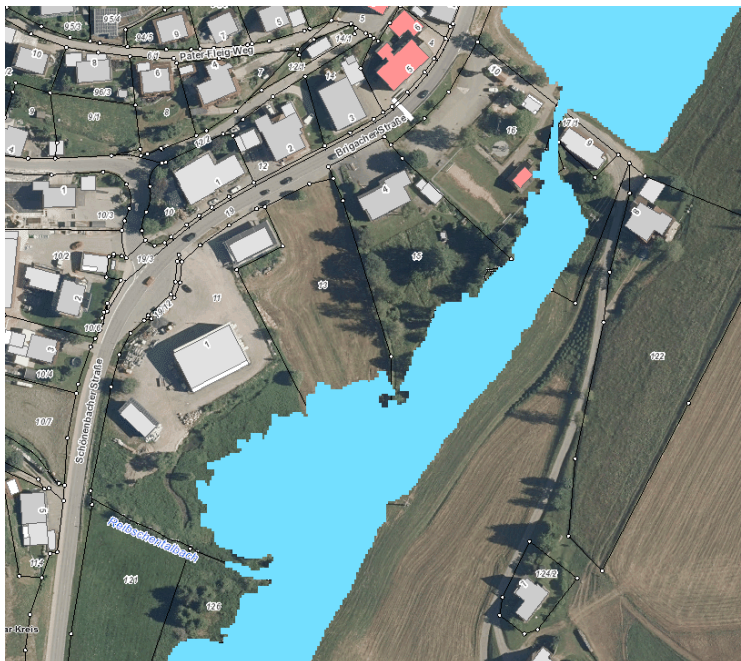
Unmaßstäblicher Auszug Hochwassergefahrenkarte mit Anschlaglinie HQ-100 (Hundertjähriges Hochwasser)

Ein Teil des Plangebietes befindet sich innerhalb des festgesetzten Überschwemmungsgebietes HQ100 des Rohrbachs. Die Errichtung bzw. Erweiterung baulicher Anlagen nach §§ 30, 33, 34 und 35 BauGB, sowie das Erhöhen und Vertiefen der Erdoberfläche ist in festgesetzten Überschwemmungsgebieten nach § 78 Absatz 4 und § 78a Absatz 1 Nr. 5 WHG untersagt. Die Anschlaglinien des HQ100 sind aus nachfolgendem Kartenauszug ersichtlich.