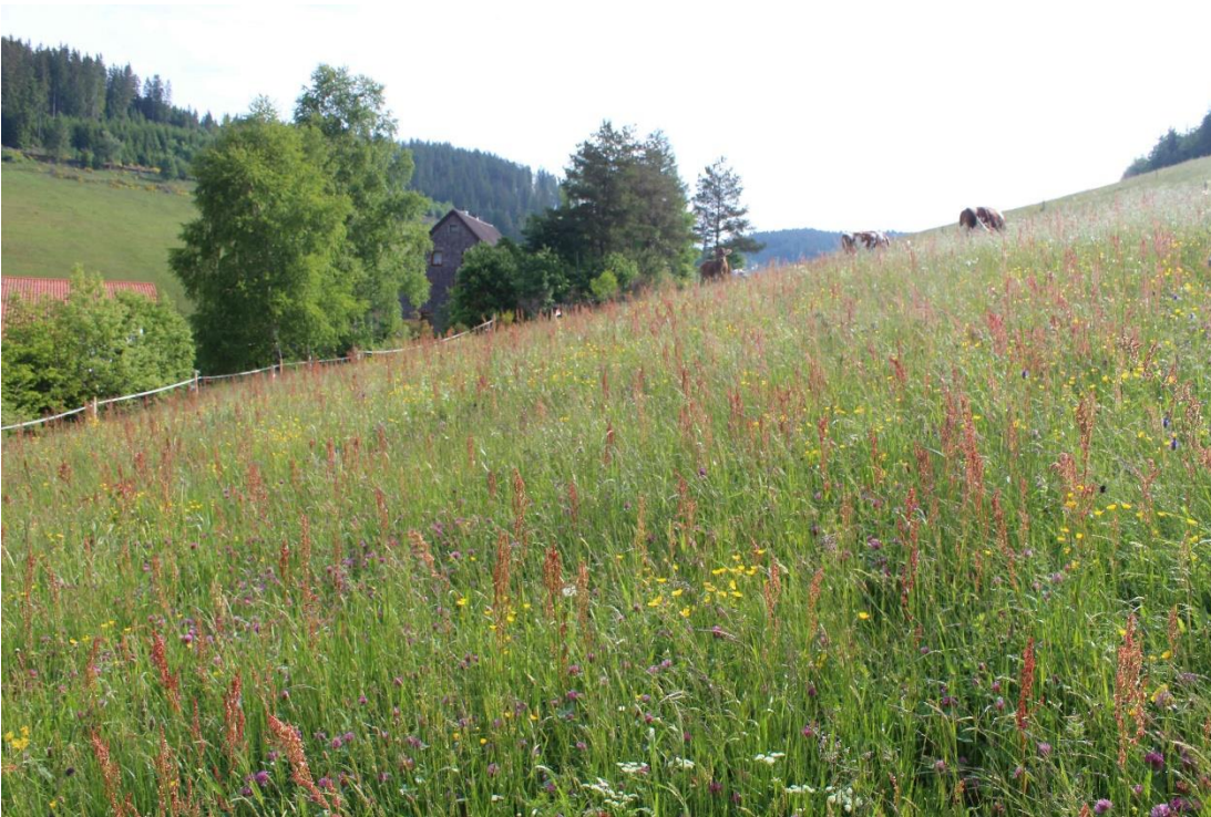
Bild 3: Artzusammensetzung der Wiese FIST 441/12, Blickrichtung Ost