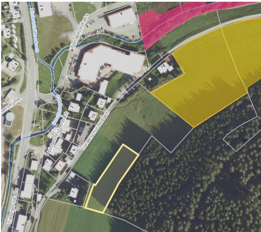
Abb. 4: Vorschlag Ausgleichsfläche FFH-Mähwiese (hellgelb umrandet)

Büro für Grün- & Landschaftsplanung Doris Hug Bregenbach 9 78120 Furtwangen – Neukirch