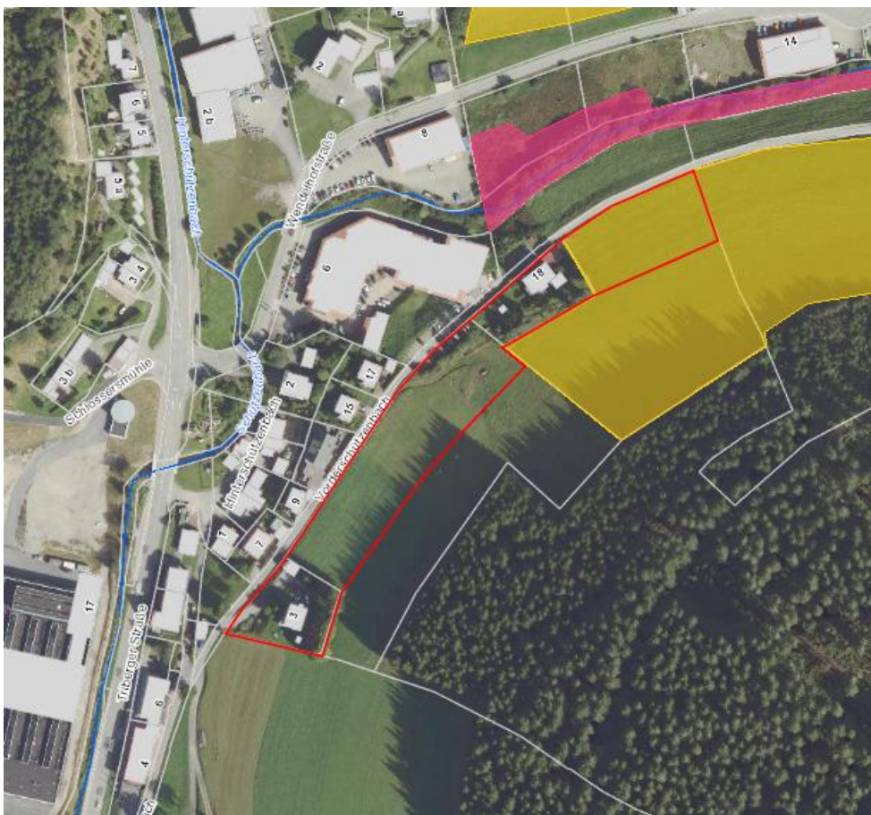
Abb. 2: Lage des näheren Untersuchungsraums im Bereich Vorderschützenbach