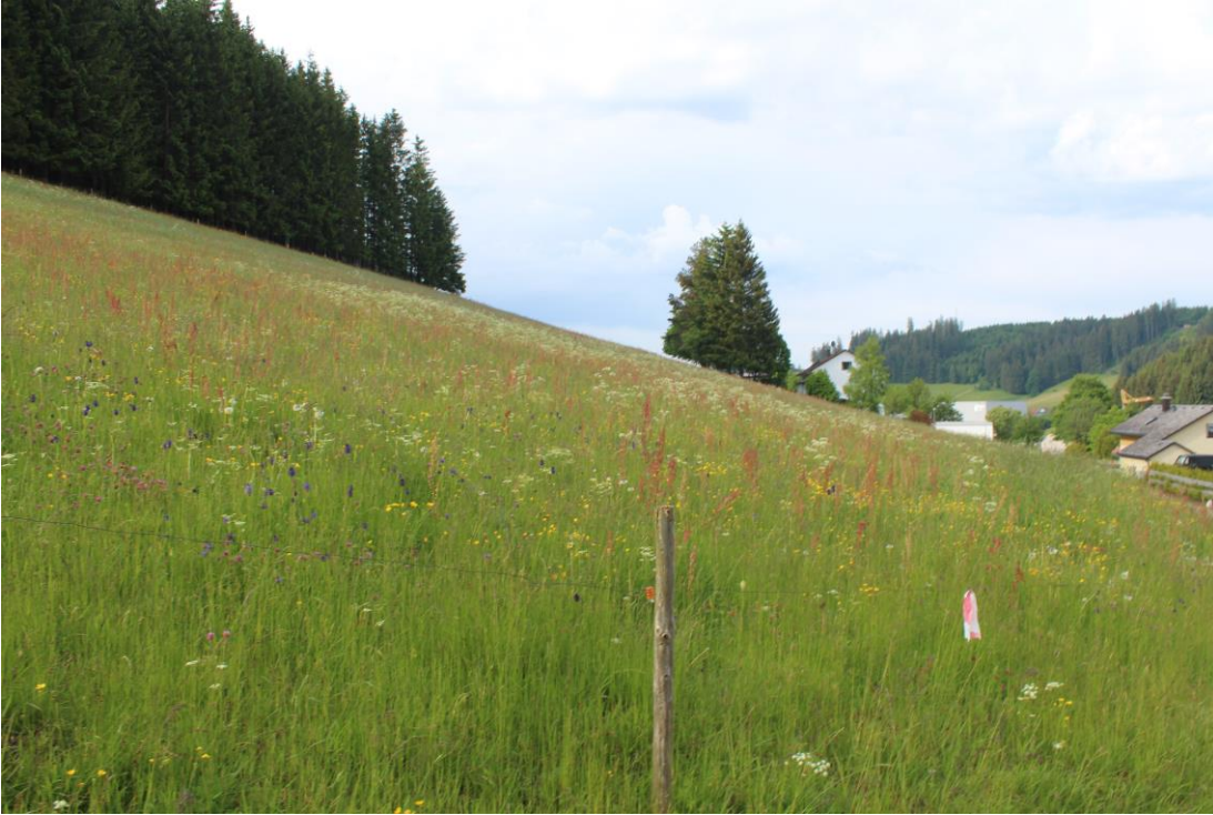
Bild 1: Randbereich der Grünlandfläche auf Flurstück 441/12 Richtung Süden