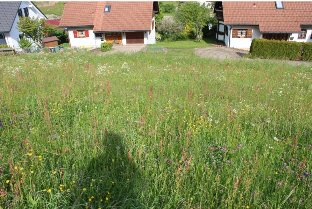
Bild 2: Zusammensetzung in der Grünlandfläche Richtung Nordwesten/hangabwärts