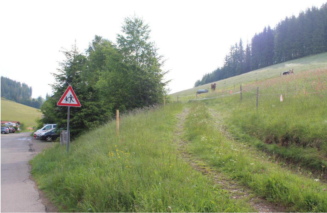
Bild 7: Parkplatzfläche südlich von Haus Nr. 18 mit Gehölzsukzession aus Fichten, Birken, einem Bergahorn und einigen Salweiden