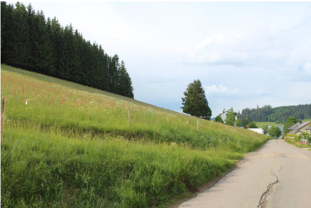
Bild 6: bestehende Asphaltstraße Vorderschützenbach mit FIST. 441/12 Richtung Südwesten